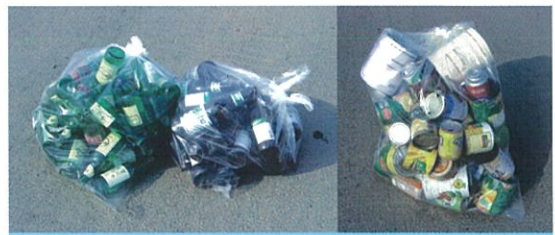
병류, 캔류, 플라스틱류