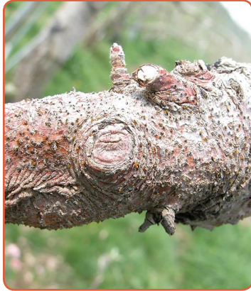
▲ 사과 부란병 증상