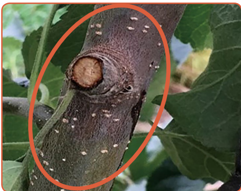
▲ 수침 증상의 궤양