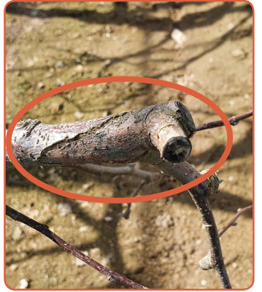
▲ 수피가 움푹 들어가 경계가 생기는 궤양