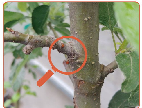
▲ 다습한 환경에서 가지에 갈색의 세균액 누출