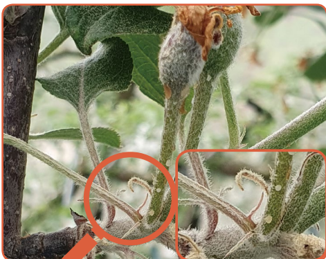
▲ 수정된 꽃의 꽃대에서 우윳빛의 세균액 누출