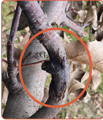
▲ 검게 변하여 마르는 궤양