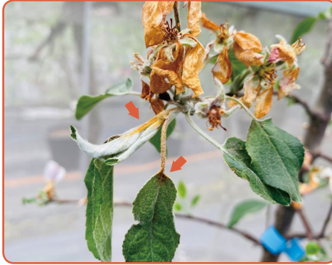
▲ 감염된 꽃 인근의 새순과 잎이 갈변