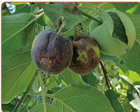
▲ 과실이 갈변하고 물에 젖은 듯한 증상이 확산됨