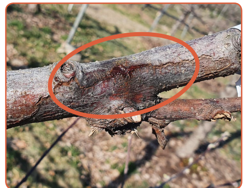
▲ 봄철 물오름기에 궤양에서 수액과 함께 세균액 누출