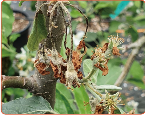
▲ 꽃 전체가 시들어 마름