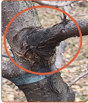
▲ 수피가 터지고 검게 변하는 궤양