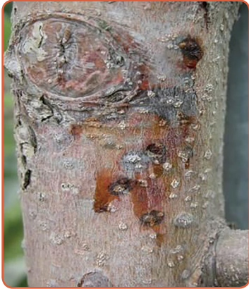
▲ 사과 겹무늬썩음병 증상