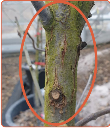
▲ 수피가 갈라지는 형태의 궤양