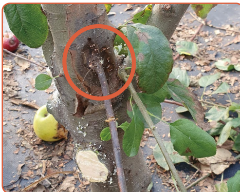
▲ 줄기 궤양에서 수침상이 멈추고 바깥쪽으로 경계 형성