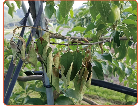
▲ 어린가지 끝이 시들어 갈고리 모양이 되고 잎이 주맥을 따라 갈변