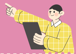
- 상담사와 함께한 참여자들의 이야기