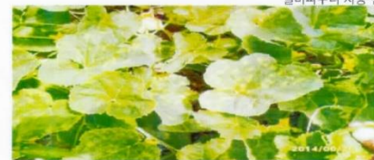
노균병 균핵병이 발병된 참외 상태