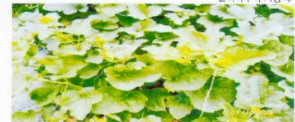
캘비 파우더 전면 살포 후 정상적으로 잘 자라고 있는 모습