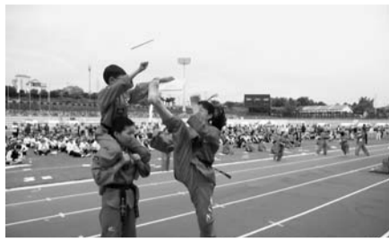
종목의 체육대회와 노래자랑 및 행운권 추첨 등으로 풍성한 어울림 한마당잔치를 가질 계획이다.

이날의 주요행사로는 개회식과 종목별 체육대회, 어울림한마당 순으로 진행되며 총 37개 마을을 8개 팀으로 구성하여 대표선수들이 참가한 가운데 남·녀 400M계주, 팔포대 이고 달리기(여), 단체줄넘기, 여자 P·K, 윗놀이, 줄다리기, 어르신낚시 등 총 8개