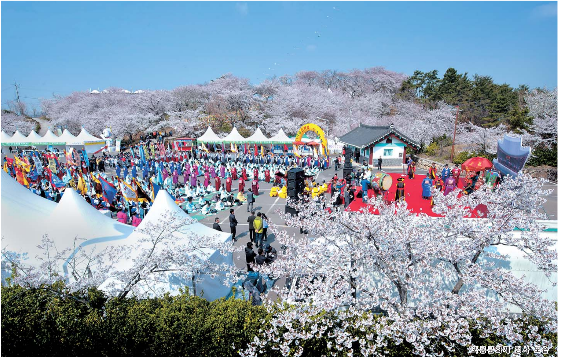
와룡문화제 행사 모습

제19회 와룡문화제 4월 10일~13일까지 열려... 벚꽃과 어우러져 볼거리 가득