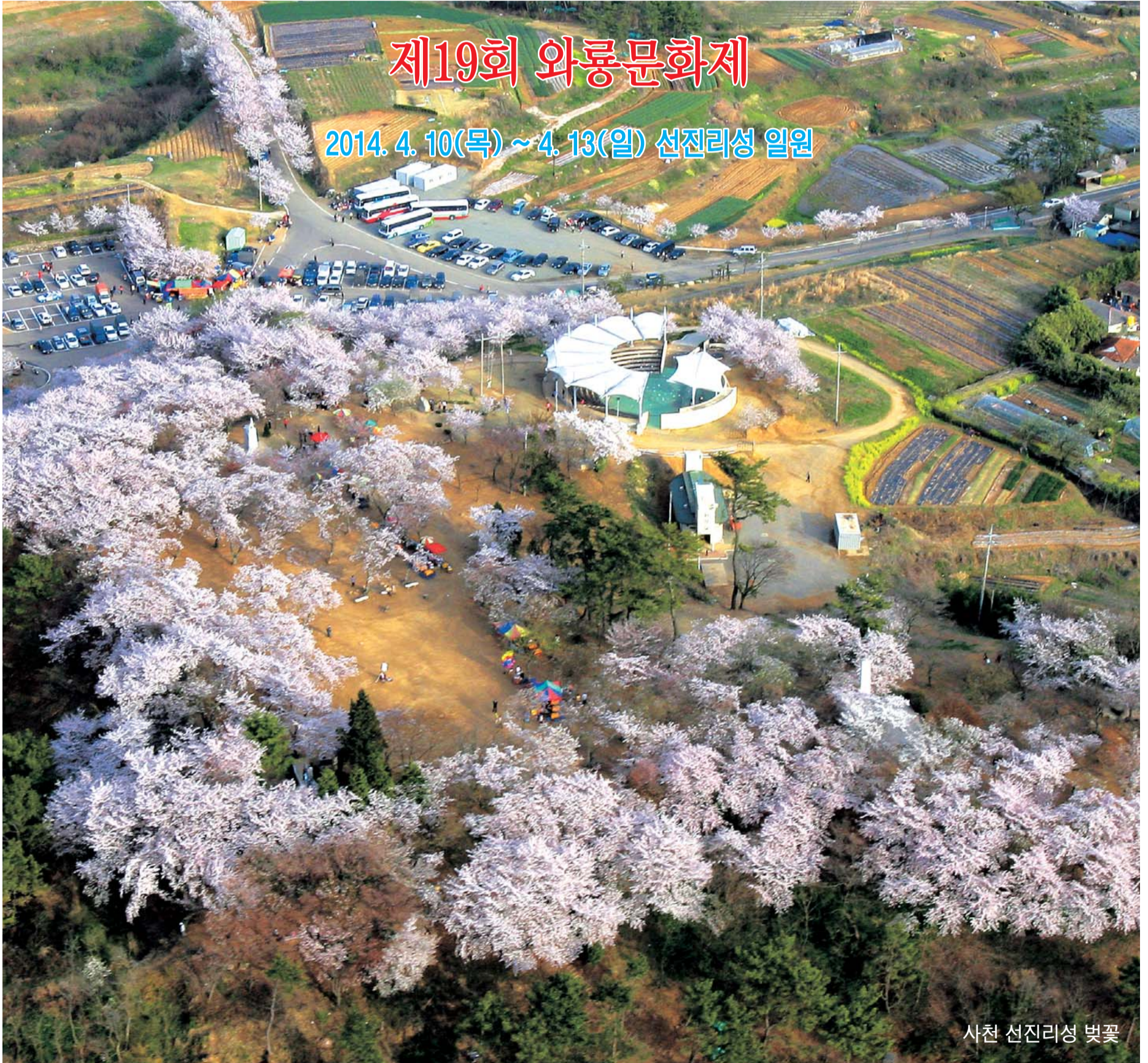
사천 선진리성 벚꽃