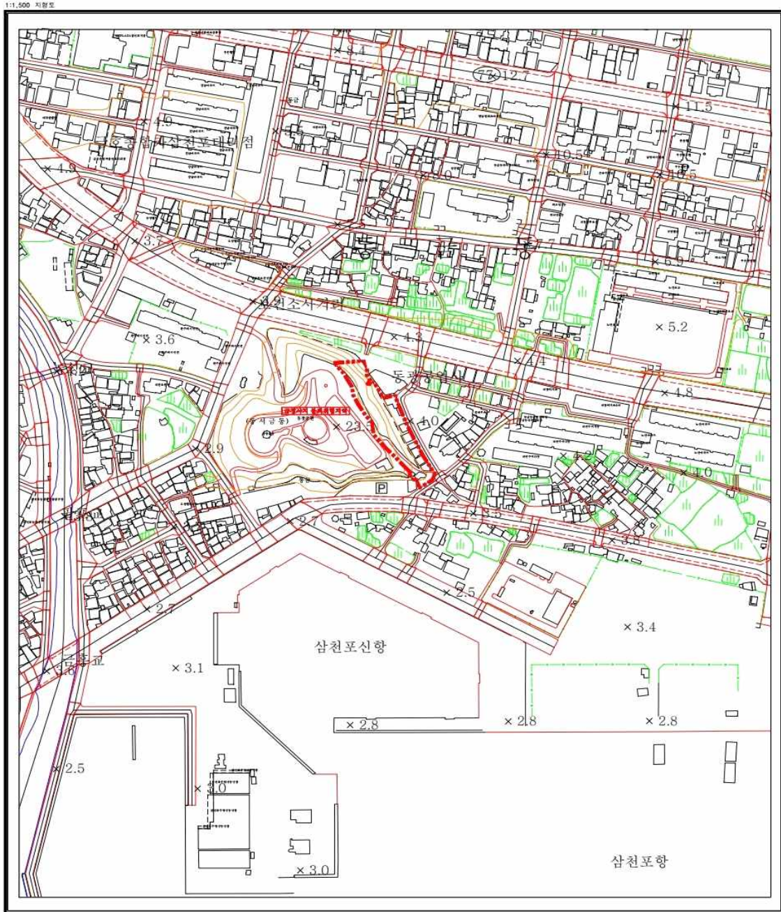
사천 급경사지 붕괴위험지역 지정 지형도면고지도