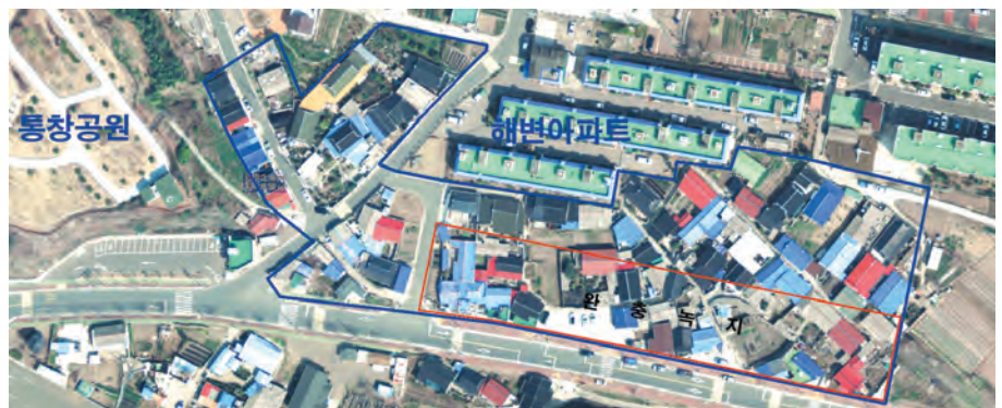
사천시 동서금동 통창지구.

또한 동서금동 통창지구는 70여 가구, 120여 필지이며, 1980년대 태풍 "셀마"에 주택 피해를 당한 이재민 집단이주지로 1987년 11월에 국유재산 매입 시정 조정위원회의 의결에 따라 국유지였던