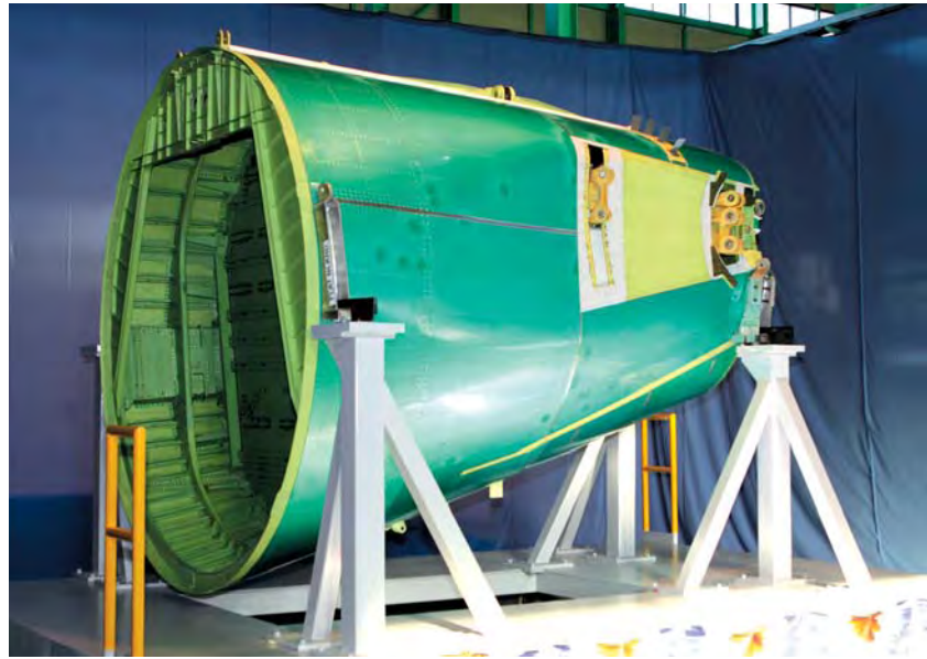
아스트의 주력상품인 항공기 동체.

잔고를 보유하고 있으며, 향후 수출 주도형 'One Stop Supplier'로서 전 세계의 항공업계를 주도하는 업체로 성장할 것으로 평가받고 있다.