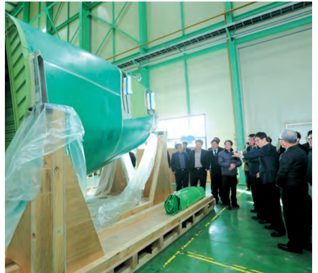
6일 간부공무원 40여명이 항공부품 기업 ㈜아스트를 방문했다.