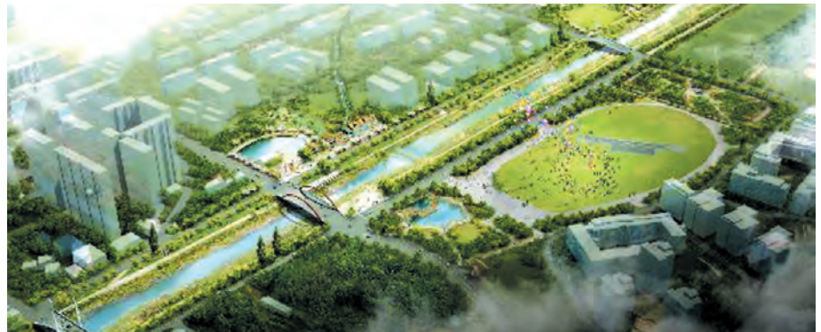
사천강 정비 조감도.

이에 따라 시는 2020년까지 총 사업비 240억원(국비 120억원)을 들여 2.81km 구간의 사천강 가치 향상과 시민이 공감하는 하천사업 추진은 물론 역사·문화를 접목시켜 관광자원화 할 계획이다. 또한 교량 1개소 재가설, 2.81km 구간 중 제방과 부속구간 축제 정비, 다목적 수변공원 설치, 보 개량 2개소, 도로정비 등도 함