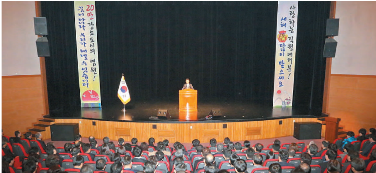
지난 4일 오전 문화예술회관 대강당에서 열린 사천시 시무식.