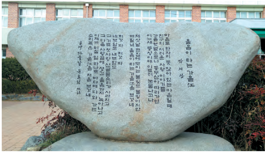
삼천포고등학교에 위치한 박재삼 시비(울음이 타는 가을강).

(전략)시골에서는 내가 있을 자리에 대하여 염려를 해 주었다. 야간의 공민학교인 노산학원에서 경리도 보고 겸하여 교편도 잡아달라는 부탁이었다. 집안 사정이 말이 아니어서 거거서나마 몇 폰 받으면 집에 보태줄 수가 있어, 내게 어울리는 직장인지도 몰랐다. 대학도 못 간 주제(그때 내 국민학교 동창들은 대학 3학년이다)고 있었다)에 그만한 직장은 분에 넘친 것이기도 했다. 그러나 나는 대학 진학의 꿈도 있었고, 또 문단 진출의 포부도 있었다. 섣뚱 내키지가 않았다. 그래서 한 달이라는 기한을 달라 하고는 무작정 상경을 했다. 대학도 가야 하겠고, 문학도 해야 하겠다는 욕심이 (역시 시골에서 보다는 서울에서)였다. 그런 것은 꿈만 그렇다는 것뿐이지 나는 돈 한 푼이 없었다. 고무신을 신고 경부선 열차에 올랐던 것이다. 이때 상경한 것이 결국은 시골 생활을 벗어난 결과가 되고 말았다. 《현대