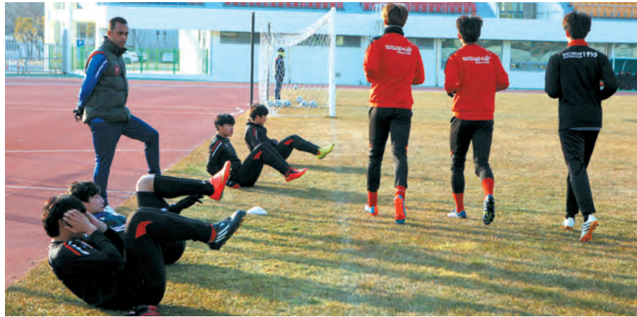
부천 FC 전지훈련 장면(삼천포종합운동장).

시는 지난해 12월 서울시청 여자 프로 축구팀을 시작으로 부천 FC를 비롯한 프로 축구팀과 유도 국가대표 상비군, 시흥시 소래초등학교 야구팀 등 49개팀 1,100여명이 전지훈련을 마쳤으며, 앞으로도 명지대, 상무체육부대 등 4개 축구팀 120여명이 전지훈련 예정으로 그 규모는 더욱 늘어날 전망이다. 이번 전지훈련 팀들은 적게는 일주일에서 많게는 한달 정도로 사천시에 체류하고 전체 연인원은 1만6천여명에 달하게 되며, 7억4천만원 정도의 지역경제 파급효과가 있을 것으로 기대된다. 이는 사천시가 산과 바다