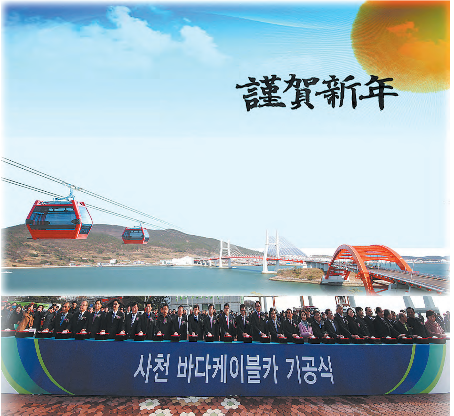
사천시는 지난달 22일 삼천포대교공원에서 '사천 바다케이블카 기공식'을 갖고, 본격적인 공사에 들어갔다.(관련기사 4면)