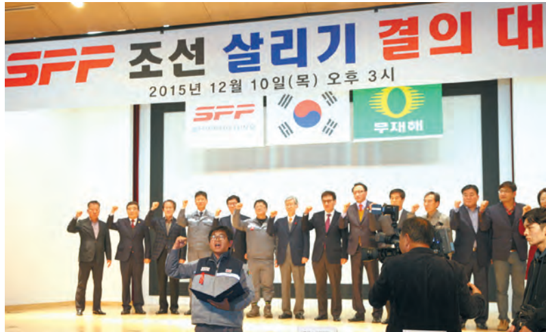
SPP조선 정상화 결의대회.

SPP조선은 수익력과 경쟁력을 확보할 수 있는 5만톤급 석유화학운반선(MR)을 주력제품으로 친환경·연비절감형 선형개발 등 차별화된 품질과 원가 경쟁력을 확보했다. 이미 지난 2008년~2013년 전세계 MR 탱커 발주량의 51%를 수주해 MR시장의 새로운 강자로 등극해, 현재까지 전체 인도된 269척 중 MR 건조 비중은 144척 53.5%로 MR 탱커에 특화돼 있고, MR선종을 건조하는 타조선소들과 비교