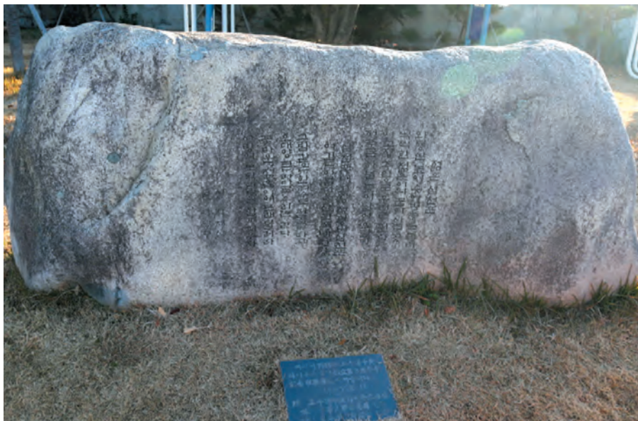
옛 삼천포시청 안에 위치한 박재삼 시비(젊은 삼천포).

이 시비는 박재삼 시인이 한참 활동하던 시기인 1988년에 그분이 자라났던 고향 동산인 노산공원에 세워졌습니다. 생존 시인의 시비를 세우는 일이 흔치 않았던 시기에 세워져 화제가 되었을지 모르겠습니다. 이 시비를 건립한 사람은 이 지역에서 청년회의소 회장을 지냈던 어떤 부부라고 알고 있습니다. 평소 박재삼 시를 좋아했던 그 부인되는 분이 다달이 저축한 돈으로 이 시비 건립 자금을 충당했고 일의 추진은 바깥양반이 했다 합니다. 시비에는 청년회의소에서 세웠다고만 되어 있습니다. 이 시비가 선 자리는 박재삼 시인이 직접 지정했다고 합니다. 당신이 늘 놀러와 생각에 잠겼던 자리라면서 공원 안에서 약간 궁벽한 자리를 지정했다는 것