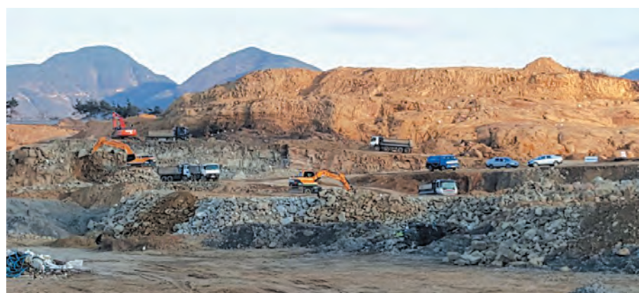
공사 중인 종포일반산업단지.

11월 사업 준공과 동시에 분양을 완료하게 되며, 기타운송장비 제조업, 전기장비 제조업, 금속가공 제품 제조업 등을 유치하여 1,000여명의 고용 및 1,400억