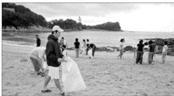
남일대 해수욕장에서 아르바이트 대학생들이 환경정비를 하고 있다.

시는 여름방학을 맞아 관내 주소를 둔 대학생들에게 사회 적응 능력 향상을 위한 다양한 현장체험의 기회를 주고 학비까지 스스로 벌 수 있도록 '대학생 여름아르바이트'를 오는 8월 22일까지 실시한다. 대학생 여름 아르바이트는 남일대해수욕장, 가천용소, 진분계 숲 등 여름철 피서객이 많이 찾는 유원지 등에서 환경정비활동과 쓰레기 불법투기 감시, 실내수영장 안전관리, 사무보조 등 다양한 분야에서 현장체험활동을 하게 되며, 관내 27개소에서 240명의 학생이 참여한다.