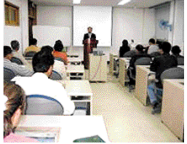
농업인의 정보화 활용능력 배양으로 인터넷을 이용한 전자상거래를 활성화시켜 농가 소득증대에 기여하고자 지난 7월

30일부터 8월7일, 9월3일에서 11일까지 각각 9일과 20일을 저녁 8시에서 12시까지 20명을 대상으로 농업인 정보화 비즈니스 부부 야간교육을 실시하고 있다. FTA 대응을 위한 새로운 전략으로 농산물 판매를 개선하고 농업정보화를 활성화시켜 농산물 직거래로 농가 소득증대 시키고자 농업인 사이버 연구회원 중심으로 홈페이지 운영,요령, 새로운 마케팅으로 소비자를 끄는