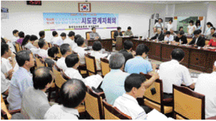
지난달24일 사천시 대회의실에서 한국민속예술축제 전국 시도 대표자 회의를 열고 대회 장소와 일정, 내용에 관한 회의를 하고 있다.

대한민국 최대의 전통문화행사인 제48회 한국민속예술축제가 한려수도의 중심지 경남 사천시에서 개최된다. 문화관광부, 경남도, 사천시, KBS가 공동주최하는 이번 축제는 오는 10월2일부터 6일까지 대방동 삼천포대교 공원에서 화려한 막을 올린다. '함께하는 민속축제, 사천에서 신명나게'라는 주제로 열리