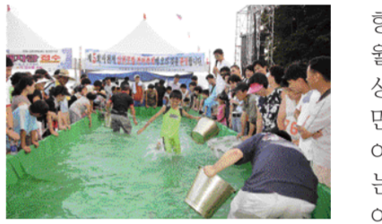
전어축제에 참가한 관광객이 손으로 전어잡기 대회를 벌이고 있다.

제6회 사천시 삼천포항 전어축제가 오는 8월8일부터 8월12일까지 5일간에 걸쳐 노산공원 옆 서금동 팔포매립지에서 삼천포항전어축제추진위원회 주관으로 개최된다. 전어는 여름~가을에 걸쳐 사천만과 갯지바다에서 많이 잡히는 우리고장 특산품으로 마도 갈방아 어요에도 등장하다시피 마도를 중심으로 전어잡이 어업이 성행해 왔다. 8월에는 빠가부드럽고 육질이 연하며 독특한