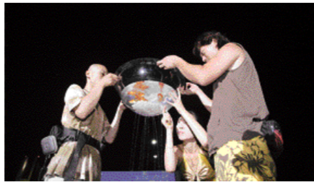
삼천포 대교공원에서 일본의 한 행위예술가가 공연을 하고 있다.

인간과 환경을 주제로 한 제14회 사천시 삼천포 국제행위예술제가 오는 8월7일부터 8일까지 삼천포대교 공원에서 개최된다. 이틀간의 일정으로 매일 밤 8시30분부터 열리는 예술제는 국내외의 12개 팀이 참여해 릴레이 퍼포먼스를 펼쳐게 된다. 예술제에서 일본의 '유미코니일'과 '후루가와 온', 싱가포르의 '소피아 나타샤 웨이', 핀란드의 '이르마 오피스트'는 여성