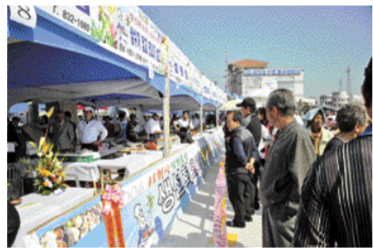
작년에 개최된 삼천포항 수산물 축제 생선회 요리 경연대회에서 선보인 생선회 요리를 시민들이 지켜보고 있다. 사진은 관계자들의 사기진작과 자긍심을 높이기 위해 지난해 처음 개최돼 많은 시민들과 관광객들로부터 큰 호응을 받은 바 있다. 2007 사천시 삼천포항 수

삼천포항 수산물축제 위원회(대회장 김수영 사천시장)는 지난 7월16일 사천시청 중회의실에서 모임을 갖고 추진위원회 임원선출, 축제위원회 운영규약(안), 예산(안), 행사계획을 심의 의결하는 등 2007 사천시 삼천포항 수산물 축제 계획을 확정했다. 삼천포항 수산물 축제는 지역에서 생산되는 싱싱한 활어회와 건어물을 비롯한 다양한 수산물의 우수성을 대내외에 알리려 우리고장 수산물의 소비를 촉진함으로써 지역경제 활성화를 도모하고 수산업과 관련 산업에 중