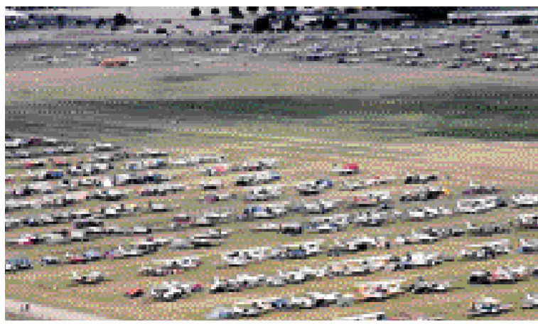
할주로를 사이에 둔 민간비행기 전시장, 행사기간동안 자기 비행기 옆에서 텐트를 치고 지낸다.

〈1면에 이어〉 오슈코시 행사장 주변에는 관광객들을 위한 오토캠핑장과 텐트캠핑장 등을 조성해 놓았는데, 행사가 열리기 한 달 전부터 캠핑장은 이미 만원이다. 2006년의 경우 공식입장료를 낸 관람객이 일주일간 80만 명에 달했으며 순수익만도 130억원 정도였다고 한다. 2007년은 그 이상의 규모를 예측하고 있었다. 이제 오슈코시라는 도시이름이 항공이벤트의 대명사로 불리고 있는 이유를 알 것 같다. 오슈코시가 이처럼 세계적인 항공메카로 자리 잡은 것은 결코 우연이 아니었다. 30년전 10대의 자그마한 비행기로 시작하여 지금 세계최대의 항공이벤트 관광도시가 된 것은 민·관·학·