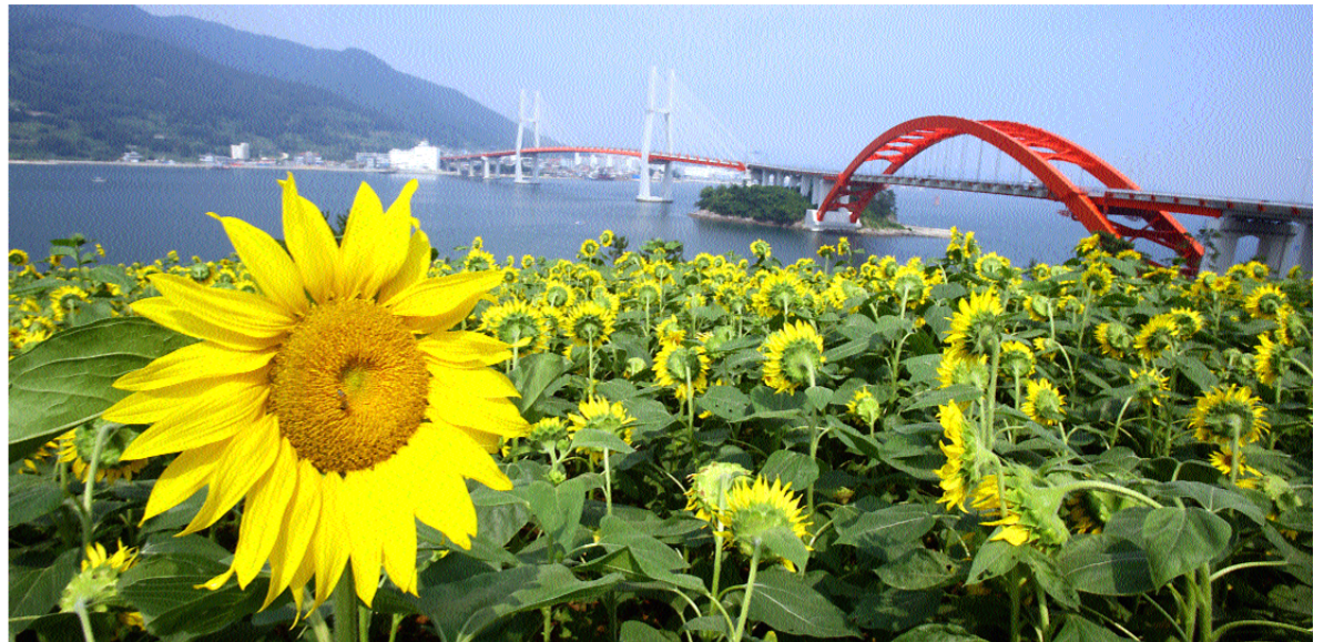
한 여름 띄윌벌이 내리찍는 가운데 초양도 해바라기가 한창 자태를 뽐내고 있다. 해바라기 대부분이 해뜨는 쪽인 삼천포대교를 향하고 있어 이채롭다.

삼천포대교 주변에 한없이 펼쳐진 해바라기가 만개해 꽃물결을 이루면서 쪽빛 바다와 어우러져 장관을 연출하고 있다. 이 곳의 해바라기 단지는 사천시가 지난 봄 유채꽃을 피워 관광객에게 불거리와 즐거움을 선사한 곳으로, 유흥농지 20,000㎡에 지난 5월말 해바라기 씨를 파종, 2개월 만에 만개해 긴 장미에도 아랑곳없이 한여름의 정취를 풍기고 있다. 특히 이곳 해바라기 단지는 한국의 아름다운 길 100선에서 대상을 차지한 창선·삼천포대교 중간 지점이자 쪽빛 바다와 함께 주변 풍광이 뛰어난 초양섬에 위치함으로써 관광객의 인기를 더하고 있다. 시는 이곳 해바라기 단지를 관광자원화 하기 위해 해바라기 단지 동편에 14억여원을 들여 대형 버스 10여대와 60여대의 승용차가 동시 주차할 수 있는 친환경적 주차장과 화장실, 매점 등의 관광 편의시설을 지난 봄 모두 갖추었다. 또한 초양도 주차장(동쪽)에서 해바라기 단지(서쪽)로 안전한 접근을 위해 도로를 횡단하지 않고도 오갈 수 있도록 초양대교 아래를 통과하는 목재데크를 설치하고, 해바라기 단지를 가로질러 가볼 수 있는 산책로와 포토존을 마련해 놓고 있어 해바라기 꽃을 즐기며 한 폭의 그림을 수놓을 수 있다.