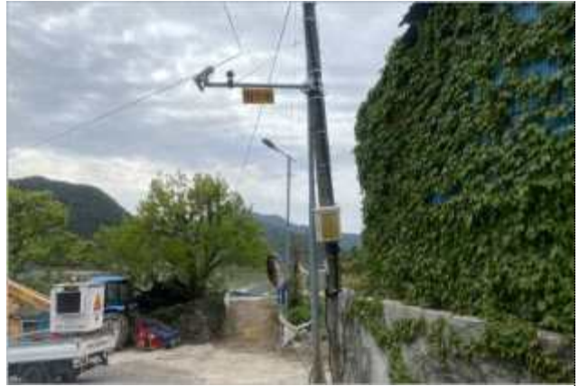
사남면 월성리 497-1(초전마을)