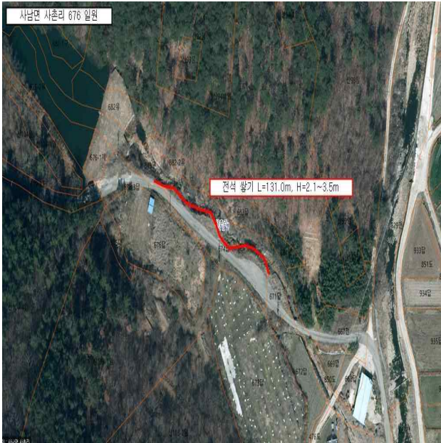
사천시 사남면 사촌리 849번지 일원