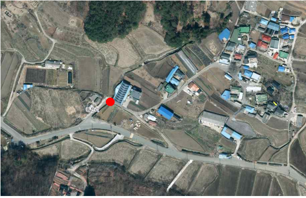
사남면 종천리 206-4(소산마을)