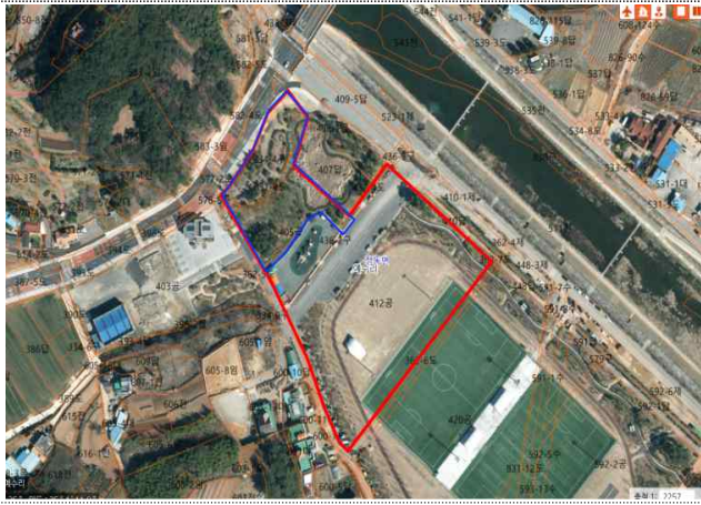
사천시 정동면 예수리 405번지 일원 (공사범위 : 파란색)