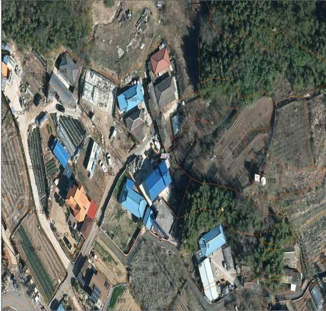
사천시 사남면 화전리 1116-2번지