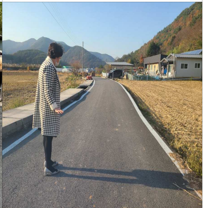
사업 효과 및 적정성 심사(자치 위원)