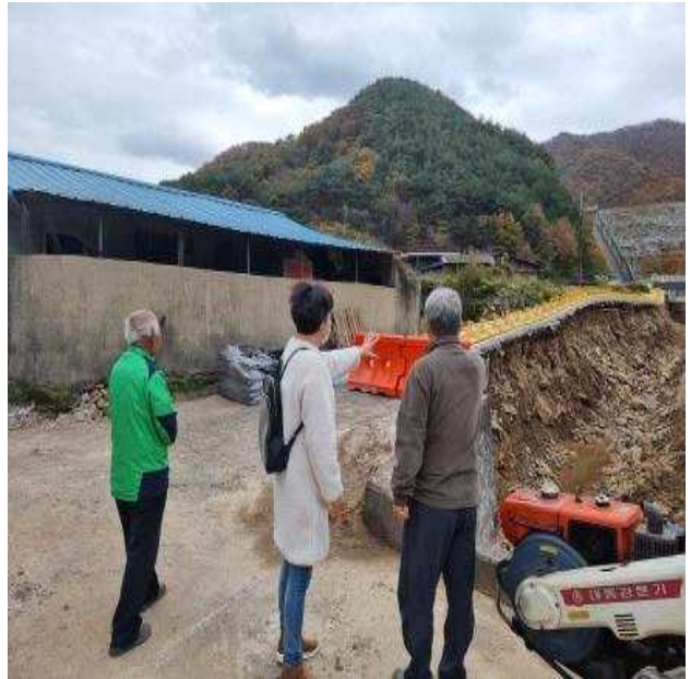
현장 확인 (사업 완료) (가천 농촌다움 복원사업 추진 중-도시재생과)