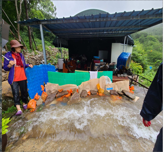
우천 시 진입로 범람 현장