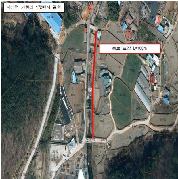
사천시 사남면 가천리 172번지 일원