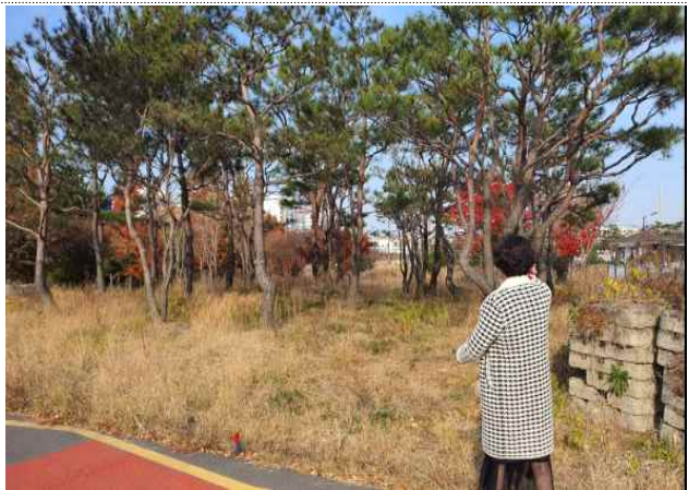
현장 실사 (사남면 주민자치위원 이**)