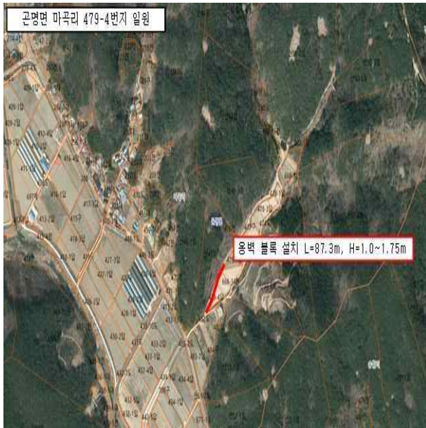
사천시 공명면 마곡리 479-4번지 일원