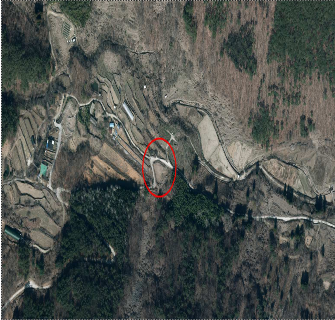
사천시 사남면 가천리 산29-1번지 일원