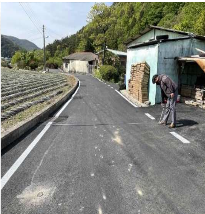
공사 준공 검사