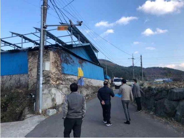
사남면 종천리 206-4(소산마을)