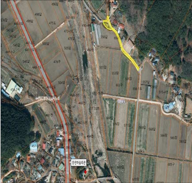
사천시 사남면 종천리 658-6번지 일원