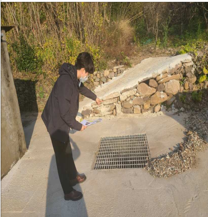
공사 준공 검사