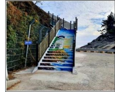
진널전망대 입구 계단 정비(후)