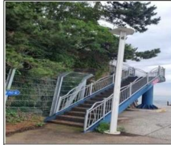
진널전망대 입구 계단 정비(전)

이렇게 제안해주신 주민참여예산 사업은 사업부서 검토, 주민참여예산위원회 등 절차를 거쳐 달라진 모습입니다.