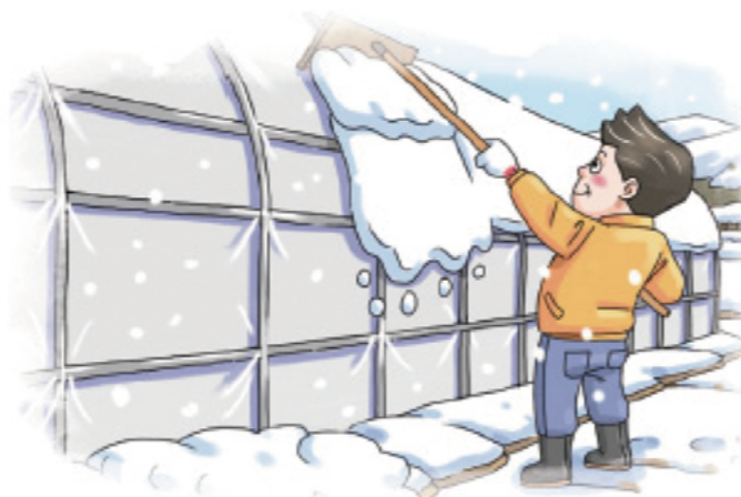
▲ 하우스 위 눈 쓸어 내기