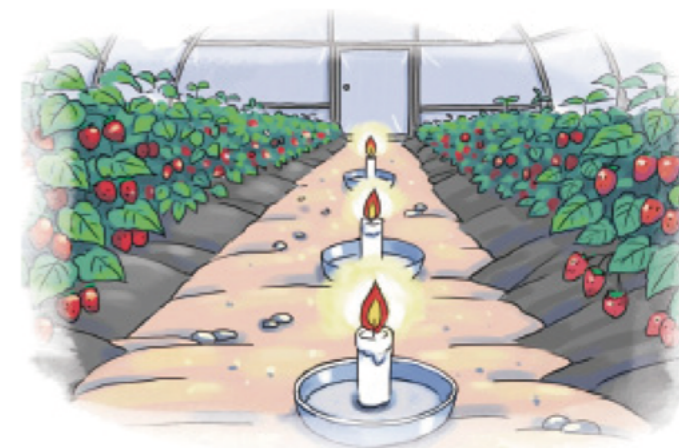
▲ 정전, 온풍기 고장시 양초·알코올 등 응급조치

응급대책 활용시 화재 위험성 및 산소부족으로 불이 꺼질 수 있으므로 세심한 관리 필요