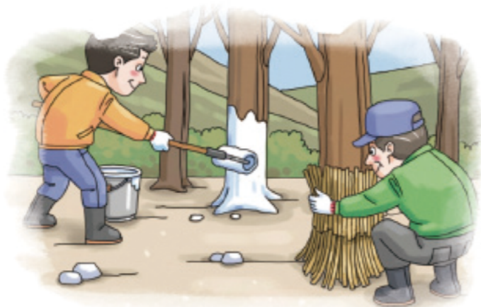
▲ 과수 주간부 벗짚피복 또는 수성페인트 칠하기