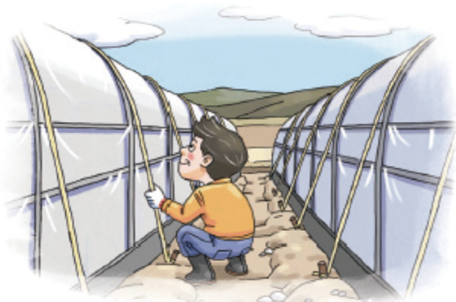
▲ 시설하우스 고정끈 설치 및 보강