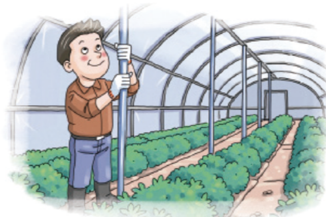
▲ 노후화된 시설 등은 보강지주 설치