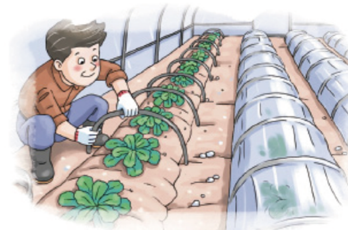
▲ 시설파손, 저온피해 우려시 소형터널 설치