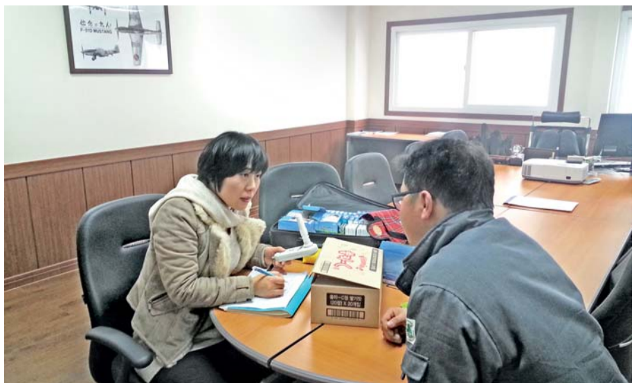
☎ 보건관리과 > 831-3569

또한 사천시는 농·어촌지역과 도시지역이 혼재되어 있어 각 집단별로 서로 다른 원인 때문에 스트레스를 받을 수 있으므로 정신보건사업의 일환으로 스트레스 관리 사업을 실시하고 여러 단체와의 연계를 통한 포괄적인 사업이 필요하며, 특히 독거노인들의 스트레스와 우울증으로 인한 자살사고 예방을 위해 독거노인 대상 사업이 실시되어야 할 것으로 분석되었다.