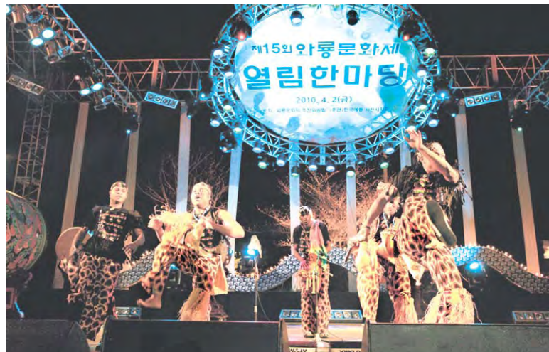
지난해 와룡문화제 열린한마당 풍경.

소리수궁가경창대회 및 사천전국고수대회와 백일장·웅변·이야기대회가 개최되며, 인근 용남고등학교 체육관에서는 미술·사진·서예·수석 등 각종 전시행사가 열린다.