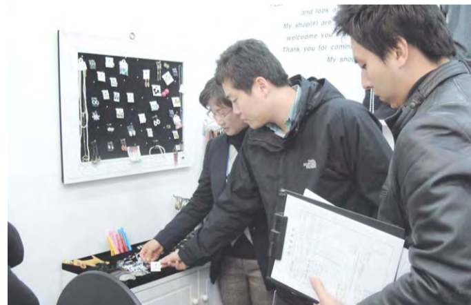
이익을 당하지 않도록 상인들에게 주의할 것"을 당부하였다. 구입을 자제해 달라고 당부했다.

시는 소비자 보호를 위해 실시하는 이번 단속에 "유명상표 위조상품을 취급해 불