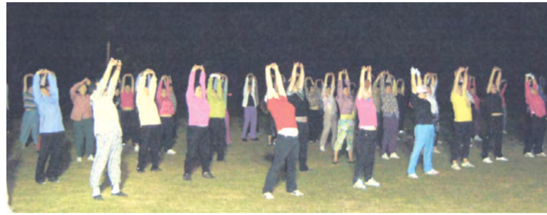
야간 주민들의 자발적인 운동 참여를 통해 운동 실천을 향상하고 건강생활 실천에 도움을 주고, 보다 건강하고 행복한 지역 만들기엔 민·관이 함께 협력하는 건강증진 프로젝트이다.

국민건강보험공단 사천시에서 후원하는 지역연계 운동프로그램으로 바쁜 일상생활 속에서 건강취약지역인 남양동 주민들이 보다 많이 참여할 수 있는 저녁시간대를 이용한 건강체조프로그램을 보급하여 건강한 생활습관 만들기엔 민·관이 함께 협력하는 건강증진 프로젝트이다.