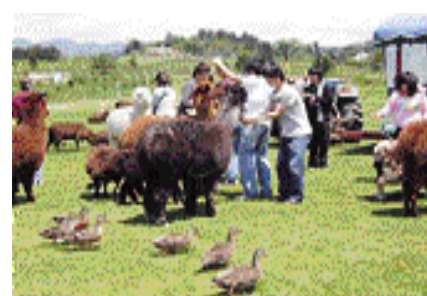
유망축종 알파카 목장 견학중인 학생

1952년 사천농업고등학교로 개교한 경남자영고등학교는 1979년 특수목적 고등학교로 지정되었고 1996년 현재의 교명을 변경했으며, 급년 54회 졸업생을 포함 6818명의 인재를 배출해 사회 각 분야에서 중추적 역할을 담당하고 있는 전문계 농업고등학교이다.