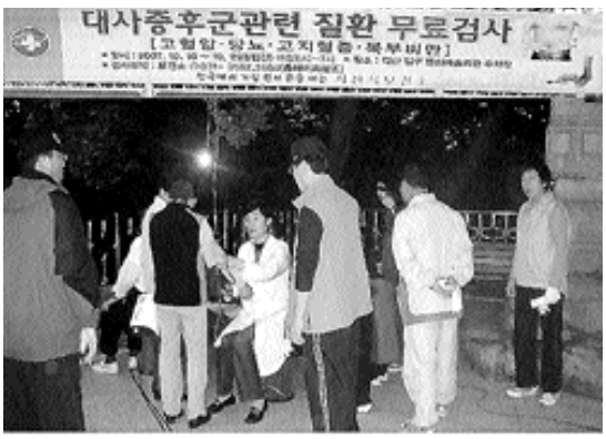
운동나온 시민이 아침 건강상태를 검사받고 있다.

사천시 보건소가 그동안 출근 및 일상 활동 등의 사유로 아침에 공복상태를 잠시 유지하기