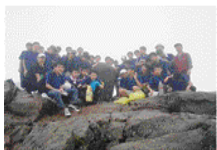
체력단련을 위한 외룡산 등반

책을 읽는 학교! 도전과 개혁의 정신을 가진 학생으로 육성하는 데 삼천포고등학교는 혼신의 노력을 기울이고 있다