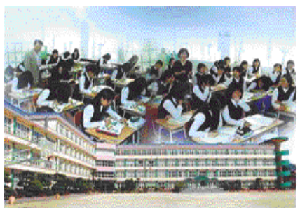
글마루 독서록 쓰기에 활동중인 학생들

1953년 삼천포고등학교 여자부로 개교한 이래 반세기 이상 동안 지역 유일의 여성교육기관으로서 인문교육 및 전문교육과정을 공동으로 운영해 국가와 지역사회 발전에 일익을 담당해왔으며 올해 52회 졸업생을 포함해 총 1만3789명의 졸업생이 배출돼 사회 각계각층에서 맡은 바 열과 성을 다하고 있다. 본교는 다가올 지식 기반 사회를 위한 인재 육성을 위해 2000년 삼천포여자고등학교로 교명을 변경했으며 탄력 있는 교육과정 운영, ICT를 활용한 수업방법 개선, 보다 쾌적한 교육환경 개선 등 급변하는 사회에 능동적으로 대처하기 위해 지속적인 노력을 추진하고 있다. 특