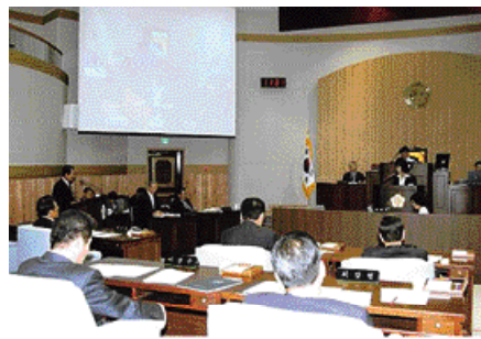
사천시의회는 지난달 8일부터 12일까지 5일간의 회기로 임시 회를 개최했다. 이번 임시회는 예산결산특별

위원회를 구성해 2007년도 제2회 추가경정 예산안을 종합 심사해 수정가결했으며, 가칭 '사천시 인재육성 장학재단' 설립 계획 외 3건의 의견청취의 건과 진사일 반지방산업단지(1·2단지) 명칭변경 건의안 외 3개 승인 안을 원안가결 하고 시정 질문과 각종 조례 안을 의결 했다. 조례안의 의결내용으로는 사천시공직자윤리위원회 구성과