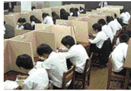
초현대식 청문재에서 공부하는 학생들

1988년 삼천포 상동회를 필두로 6개 봉사단체가 중심이 되어 지역사회 교육 여건을 개선하고, 면학풍토 조성을 열망하는 지역민의 뜻을 모아 1991년 5월3일에 개교했다. 개교 16주년을 본교는 졸업생 2967명을 배출해 서울대 의대를 비롯해 교육대학 등 전국의 우수한 대학에 진학시켰으며, 졸업생들은 사회 각계 각층에서 활동을 하고 있다. 총 15학급에 426명이 재학하고 있는 본교는 급식소, 체육관, 도서실, 컴퓨터실, 어학실, 정독실, 과학실 등을 고루 갖추고 쾌적한 교육 환경에서 효율적인 교육을 하고 있다. 학생 중심 맞춤식 교육을 중점으로