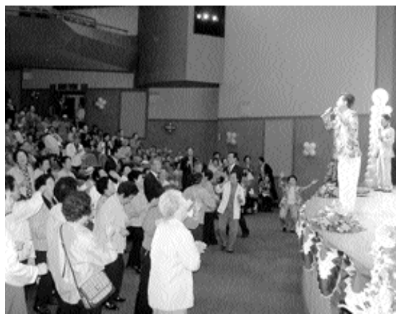
초청가수와 참여한 노인들이 노래와 춤을 함께하며 즐거운 한때를 보내고 있다

내 어르신 1000여명을 모시고 제11회 노인의 날 기념행사를 가졌다. 식전행사로 사물놀이, 에어로빅 시범이 열리고, 모범노인 및 노인복지봉사활동 기여자 표창수여와 기념식 행사, 생기 넘치고 발랄한 밸리댄스, 2부 행사는 한마음 화합의장 공연을 열었다. 이날 행사를 더욱 뜻 깊고 알차게 진행하기 위해 지역출신 가수과 유명가수를 초청해 노래하고 춤을 추었으며, 다양한 즉석 이벤트 행사로 어르신들이 함께 동참할 수 있는 무대를 마련하고, 행사 중 행운권 추첨을 통해 푸짐한 선물도 준비해 참여한 많은 어르신들에게 흥겹고 신명나는 즐거움을 선사해 뜨거운 호응을 얻었다. 이번 행사를 계기로 노인들이 행복한 사천시를 만들어 나가기 위해 노인일자리사업을 확대해 나가고 여가활동 활성화를 위해 다양한 프로그램을 지원해 나갈 계획이다.