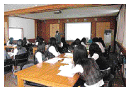
샘터교실에서 수업중인 학생들

개교 40주년을 맞이하는 사천시 유일의 순수 여자 전문계 고등학교인 사천여자고등학교는 정보처리과, 영상미디어과, 사이버유통과의 3개 학과로 구성되어 있다. 첨단 항공 산업단지 조성으로 인한 사천시의 인구 증가, 중학생 및 학부모의 대학 진학을 희망하는 추세에 부응하고자 2008학년도부터는 보통과(인문반)를 신설해 기존의 2개과(정보처리과, 영상미디어과)와 신설된 보통과로 신입생을 모집하게 되었다.