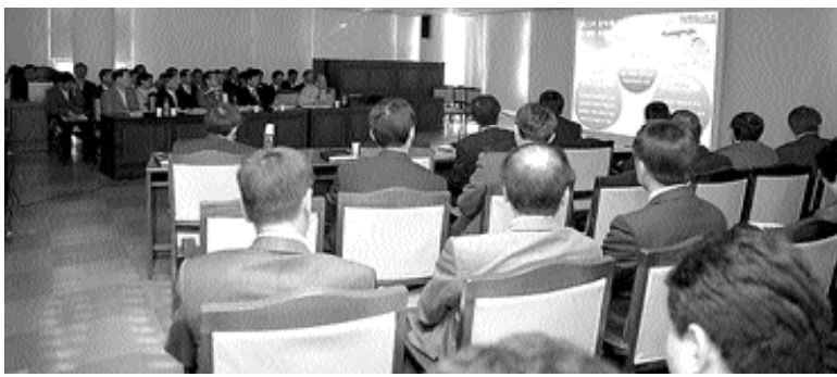
2008년도 주요업무계획 보고회 한 장면

사천시는 지난 10월 17일부터 19일까지 신청사시대를 맞아 새로운 사천건설에 총력을 기울인다는 의지와 비전을 갖고 2008년도 주요업무계획 보고회를 가졌다. 주요업무계획 보고회는 2007년도 시정의 성과를 표출 분석해 더욱 발전시키고 미진한 부분은 원인분석과 반성을 통해 2008년도는 시정을 더욱 발전시키기 위한 업무계획을 수립 추진하는데 그 목적을 두고 있다. 사천시는 2008년도에 중점적으로 추진해 나갈 사업으로 경제의 지속적인 성장과 신청사를 중심으로 새로운 도시발전 기반 구축, 시민의 삶의 질 향상, 민선4기 공약사업과 연계한 경기진작 파급효과가 큰 SOC 사업 등 대규모 사업에 집중 투자할 계획이다.