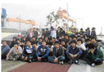
SPP해양조선에 견학중인 학생들

'수주물량 세계 1위' 조선소 업계 및 학계에선 현재의 조선산업 호황기 조가 중국의 대규모 설비 증설로 인해 2010년 이후 경기하락 가능성이 증대되고 있지만 최소한 3년, 길게는 20년까지 이어질 것으로 전망하고 있다.