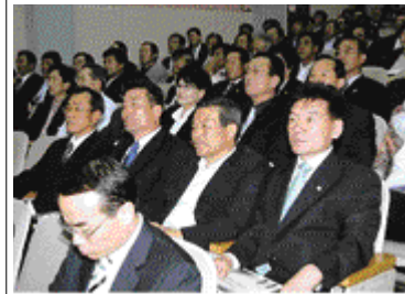
사천시의회 의원은 지난 10월 4일 오전 10시 경상남도공무원교육원에서 2008년부터 새로이 도입되는 사업예산제도 설명회에 참석했다. 종전의 품목별예산