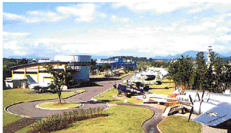
첨단 항공우주과학관이 건립되는 부지인 항공우주박물관 전경

첨단 항공산업의 메카로 항공우주산업 인프라가 형성된 사천에 '첨단항공우주과학관'이 건립 될 것으로 보인다. 이와 같은 내용은 사천시의회 업무보고에서 밝혀졌다.