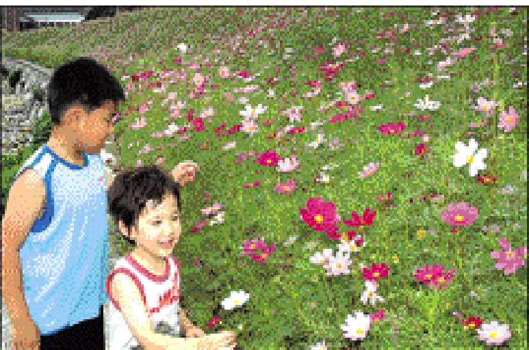
하천변에 활짝 핀 코스모스를 즐기고 있는 아이들의 모습

사천시는 2007년도 국비보조 사업 11억원으로 소하천 정비사업을 조기 발주한 3건에 대해 올해 10월 이전에 모두 준공해 주민들로부터 좋은 반응을 얻고 있다.