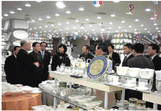
대전광역시 동구 중앙시장을 방문하여 담당자로부터 현황설명을 듣고 있다