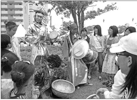
공연·전시·경연·체험 등 7개분야 50여개 종목에 걸쳐 이색적인 문화체험과 다양한 프로그램으로 마련된다.

거리 퍼포먼스, 삼바댄스, 유명 대중가수 등이 참여하는 신명나는 열림축제