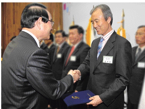
사천시가 2006년도 지방재정분석 우수기관으로 선정되어 지난 3월 26일(월) 오후 2시 30분에 충남도청 강당에서 행정자치부

장관 표창과 상사업비 1억원을 받았다. 지난해 행정자치부가 지방자치단체의 재정운영의 건전성과 효율성을 유도하고 주민에 의한 자율통제와 자치단체 간 선의의 경쟁을 통해 지방재정 발전을 목적으로 실시한 지방재정 분석 평가에서 A등급을 받은 적 이 있다. 지방재정 건전성 운용 평가는 지방세입, 재정관리, 채무관리, 재정투명성 등 30개 항목을 지표