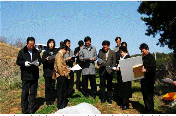
웅현면 서택지 농업농촌 테마 공원조성사업 예정지를 확인하고 담당과장으로부터 현황설명을 듣고 있다

사천시의회는 지난 3월7일부터 15일까지 9일간의 회기로 임시회를 개회했다. 이번 임시회에서는 제감생 의원이 발의한 신용카드가맹점 수수료 인하를 위한 입법촉구 결의안을 채택하고, ▲사천