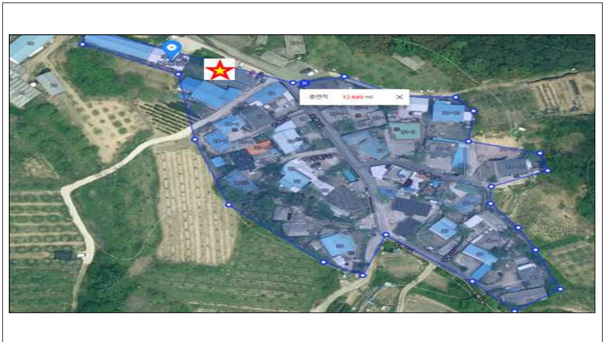
★ : 저장탱크설치 위치표시