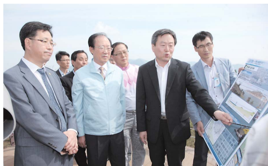
윤종수 환경부 차관을 비롯한 환경부 관계자들이 지난 9월 21일 사천을 찾아 '사천 바다 케이블카'에 대한 현장답사를 실시했다.

오는 2014년으로 예정된 사천 바다케이블카 착공을 앞두고 환경부 차관을 비롯한 환경부 관계자들이 지난 9월 21일 오전 사천을 찾아 사천 바다케이블카에 대한 현장 답사를 실시했다.