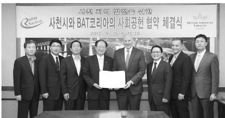
공헌은 단순히 후원을 넘어, 지역사회에 투자하고 상상하는 사회적 투자활동으로 변모하고 있다"며 "이러한 차원에서 BAT