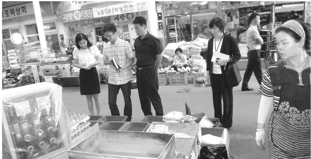
시는 한가위 추석 명절을 앞두고 나눔명절·환경정비·공직기강 확립·물가안정 등 4개 분야에 대해 행정력을 집중했다.

▲ 추석 성수품에 대한 '물가 잡기' 사천시(시장 정만규)는 추석명절을 맞아 오는 29일까지 물가관리 특별대책기간으로 정하고 유관기관, 소비자단체 등과 함께 물가관리에 나섰다. 시는 하절기 폭염과 가뭄으로 인해 제수용품 가격이 상승할 것에 대비해 주요 성수품과 개인 서비스 요금에 대해 집중 단속을 실시했다. 이번 물가안정 합동지도 점검은 시 관련 부서, 사천경찰서, 사천세관 등 유관기관으로 구성된 물가관리 현장점검반을 구성하고 농축수산물 15개 품목과 개인서비스 요금 6개 품목에 대해 현장 중심으로 지도 점검하였다. 전통시장, 대형유통 할인점, 개인서비스요