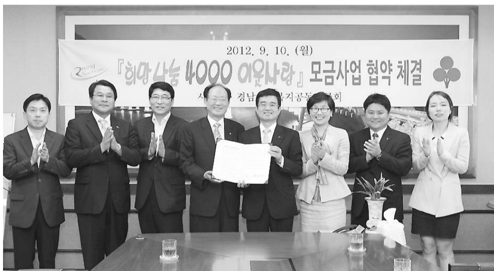
사천시와 경남사회복지공동모금회가 '희망나눔 4000 이웃사랑' 협약을 마치고 기념촬영을 하고 있다.

이와 함께 시는 나눔 문화 확산과 수요자 맞춤형 복지서비스 제공이라는 1석 3조의 효과를 얻을 수 있을 것으로 기대하고 있다. 사천시민이면 누구나 참여 가능하며, 기부금액은 1구와 4000원으로 1구와 이상 신청할 수 있다. 이용 방법은 후원신청서