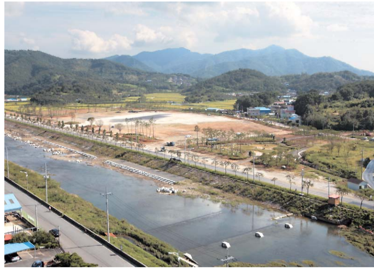
항공 우주산업의 메카, 사천에 휴양과 현장학습이 가능한 항공우주테마공원이 이달 중 막바지 정비 작업을 마무리하고 시민에게 개방된다.

테마공원 준공에 즈음한 10월 말 경에는 전국에서 5만 명의 관람객이 다녀갈 '항공우주엑스포 행사'와 '농업한마당 축제'를 비