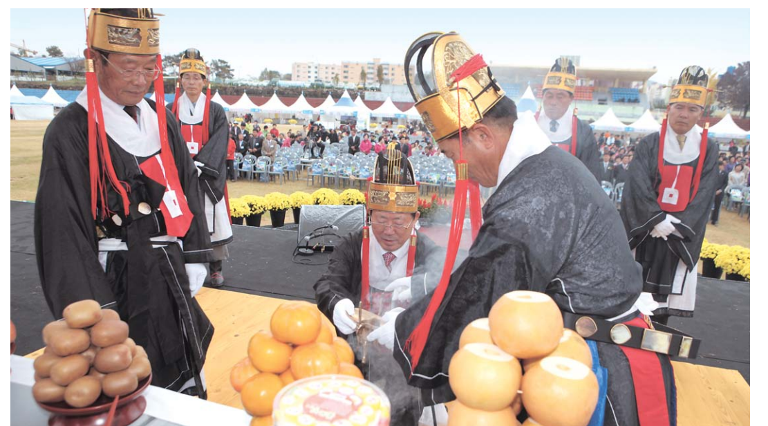
'2012 사천시 농업한마당 축제'가 10월 27일부터 28일까지 개최한다.