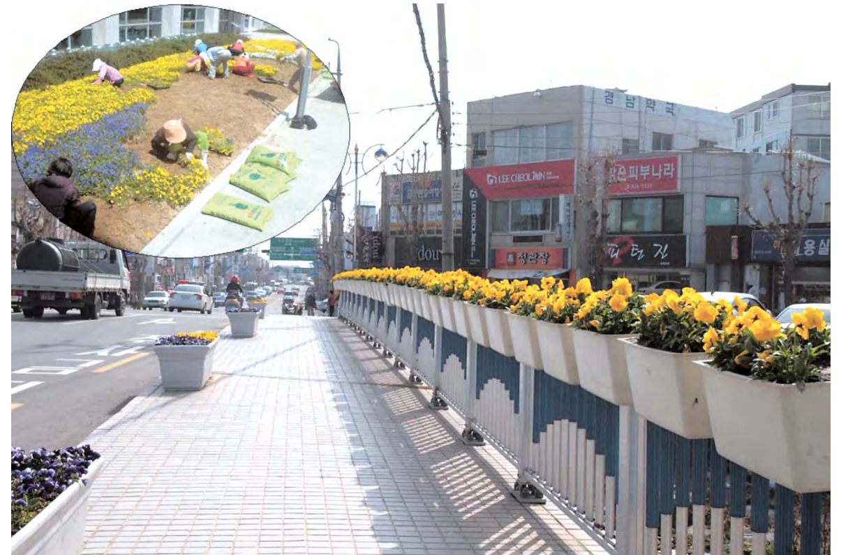
삼천포교 난간길에 꽃화분 설치로 아름다운 꽃길을 조성하였다. 원안은 사천시청 광장 봄꽃 단장 모습.

특히 전 의원의 발의와 찬성으로 채택된「진주 정촌일반산업단지 산업폐수 남강 방류 촉구 결의안」은 산업폐수의 사천만 방류는 사천만의 생태계 파괴를 가져와 시민들의 생명과 재산을 위협하는 행위로서 사천만 방류계획을 철회하고 남강 등 진주지역으로 변경하여 방류할 것을 강력히 촉구하는 내용으로서 관련기관인 낙동강유역환경청과 경상남도, 진주시, 경상남도개발공사에 전달하여 적극 반영될 수 있도록 건의기로 했다.