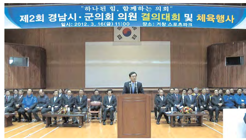
지난 3월 16일 거창군 스포츠파크에서 제2회 경남 시·군의회 의원 결의대회 및 체육대회를 개최하였다.

이날 경남시·군의회협의회는 "기초의원 중선거구제를 선거구제로 환원, 정당공천제 폐지, 열악한 기초지방 재정의 확충방안 강구 등의 지방자치발전을 위한 제도 개선 촉구 공동 결의문도 채택하였다.