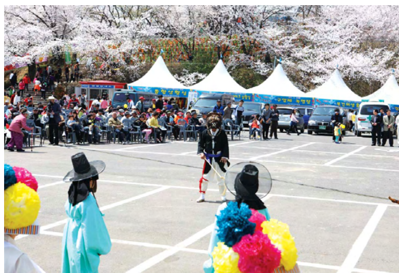
4월6일~9일까지 벚꽃향기 가득한 선진리성에서 제17회 와룡문화제 및 제3회 구암제가 펼쳐진다. 사진은 작년 재연모습.

사천문화재단 주관 4월6일~9일까지 개최 가요제 · 문화 · 체험행사 등 볼거리 풍성