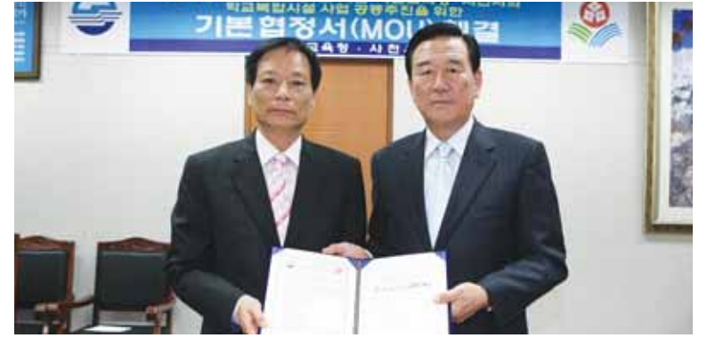
김수영 사천시장과 강인섭 교육청장이 어린이 영어도서관 건립사업 기본협정서(MOU)를 체결하고 기념촬영을 하고 있다.

사천시는 2010년 3월 개교를 목표로 사남초등학교에 학교복합시설인 '어린이 영어도서관' 건립사업 공동추진을 위해 지난 6월3일 사천시청 종합상황실에서 사천교육청과 기본협정서(MOU)를 체결했다.