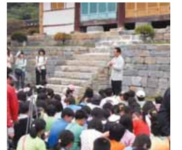
를 실재로 옮겨 인성과 예절이 바로선 나라의 큰 일꾼으로 자라 주길 당부했다.