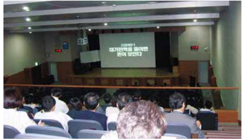
사천시는 에너지 절약을 위해 전직원 교육을 실시하고 적극적인 동참을 당부했 다.

사용하는 컴퓨터 1065대 모두를 절 전모드로 전환해 연간 2800만원의 에너지를 절감할 수 있도록 조치했 다. 직원들은 넥타이 안매기 운동을 전개하면서 적정 실내 온도를 26℃ ~ 28℃에서 2℃를 올린 28℃ ~ 30℃ 로 조정해 에어컨을 가동할 계획으 로 에너지 절약이 가능 하다면 어 떠한 불편이라도 감수하기로 하고 에너지절약을 위한 직원 교육을 실시 하기도 했다. 또한, 화석연료의 대체에너지 보 급을 위해 2008년도 지방비 5400만 원을 지원하여 태양광주택 26등을 보급하고 있으며, 태양광주택은 월 480kw(10만7210원)사용하는 가구 일 경우 연간 113만400원을 절감하