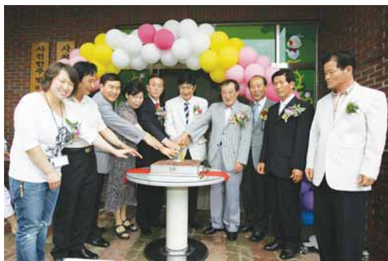
한주빌라 늘푸른 작은도서관이 개관돼 시민들의 독서문화 향상에 도움을 주게 되었다.

한 독서환경을 제공하고자 3500만원의 사업비로 사남면 월성리에 60㎡ 규모로 세워졌다. 사남면 지역은 첨단산업단지 조성과 함께 교육여건개선 사업이 함께 진행되고 있으며, 어린이 영아전문 도서관이 사남초등학교와 함께 2010년 개소할 예정에 있어 독서를 통해 지적·창조적 에너지를 재충전할 수 있는 대표지역으로 거듭날 것을 기대한다. 한편 시 관계자5는 작은도서관 사업으로 인해 독서가 생활화 되고, 시민의 독서량을 증가시켜 인제, 어디서나 학습하는 분위기를 조성할 수 있을 것으로 기대한다고 밝혔다.