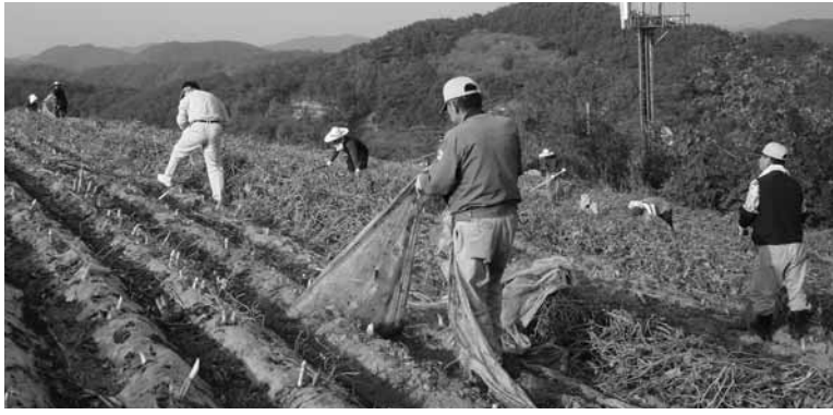
지난해 관내 농가에 공무원들과 지역단체에서 농촌일손돕기운동에 참여해 농가에 도움을 주었다.

추진 방향은 중점기간에 범시민적 농촌일손 돕기 운동을 전개해 일손부족 농가에 실질적인 도움이