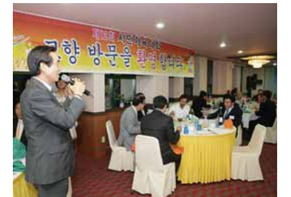
한편 이날 행사에 참석한 향우들은 시의 지속적인 발전을 위하여 각별한 관심을 가지고, 많은 관객과 투자자가 시를 찾아올 수 있도록 홍보요원으로서의 역할을 다 하기로 했다.

이날 행사는 전국에서 초청된 향우들에게 사천시의 지난 60년간의 변화된 모습과 미래 발전상을 방영하고 산업단지 조성 및 함께 의욕적으로 추진하고 있는 인재육성사업으로 교육투자