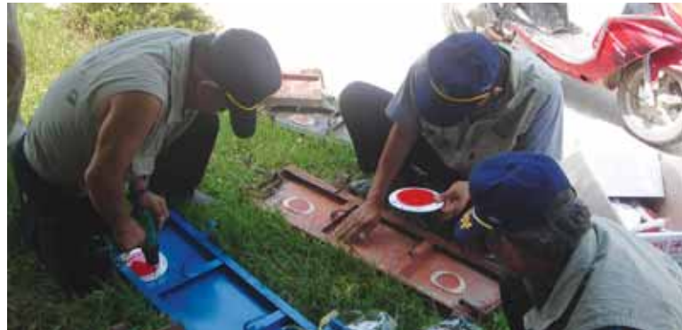
안전을 위한 경운기 야간 반사판을 부착하고 있다.

지 않고 혼합하여 배출하는 행위 ○ 신고 없이 대형폐기물을 배출하는 행위 재활용품을 배출할 때에는 품목별로 분리하여 끈으로 묶거나 내용물을 확인할 수 있도록 투명한 봉지에 넣어 배출하시기 바라며, 쓰레기 불법투기자에 대하여는 끝까지 추적하여 100만원이하의 과태료를 부과할 계획이오니, 시의 쾌적한 생활환경 조성을 위하여 쓰레기종량제에 적극 동참하여 주시길 당부 드립니다. ** 쓰레기 불법투기 신고 : 시청 환경사업소 ☎ 831-5603 **