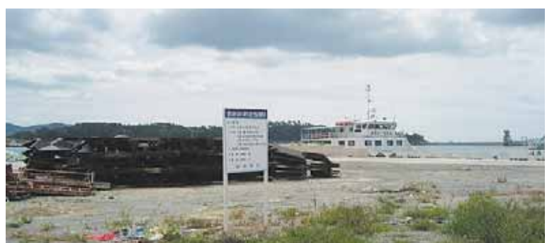
삼천포항 팔포 다목적회관 건립예정지.(수령병동 창고 옆)

월 말에 준공할 것으로 추진하고 있다. 현재 삼천포항은 통영 사랑도간 여객선이 취항되고 있으나 여객터미널 등 편의시설이 없어 그동안 승객과 관광객들이 많은 불편을 겪어 왔다. 이번에 건립될 다목적회관은 1층은 여객터미널, 2층과 3층은 회의실과 어업인의 편의시설과 회관으로 이용될 것으로 알려지고 있다. 한편 시 관계자는 다목적회관 건립이 다소 늦은 감은 있지만, 여러 연이건속에서 결정된 만큼 지역민의 적극적인 관심과 협조로 조속히 완공되기를 바라며, 삼천포항의 명실상부한 여객터미널로 승객들의 불편해소와 지역관광 활성화에도 크게 기여될 것으로 기대된다고 말했다.