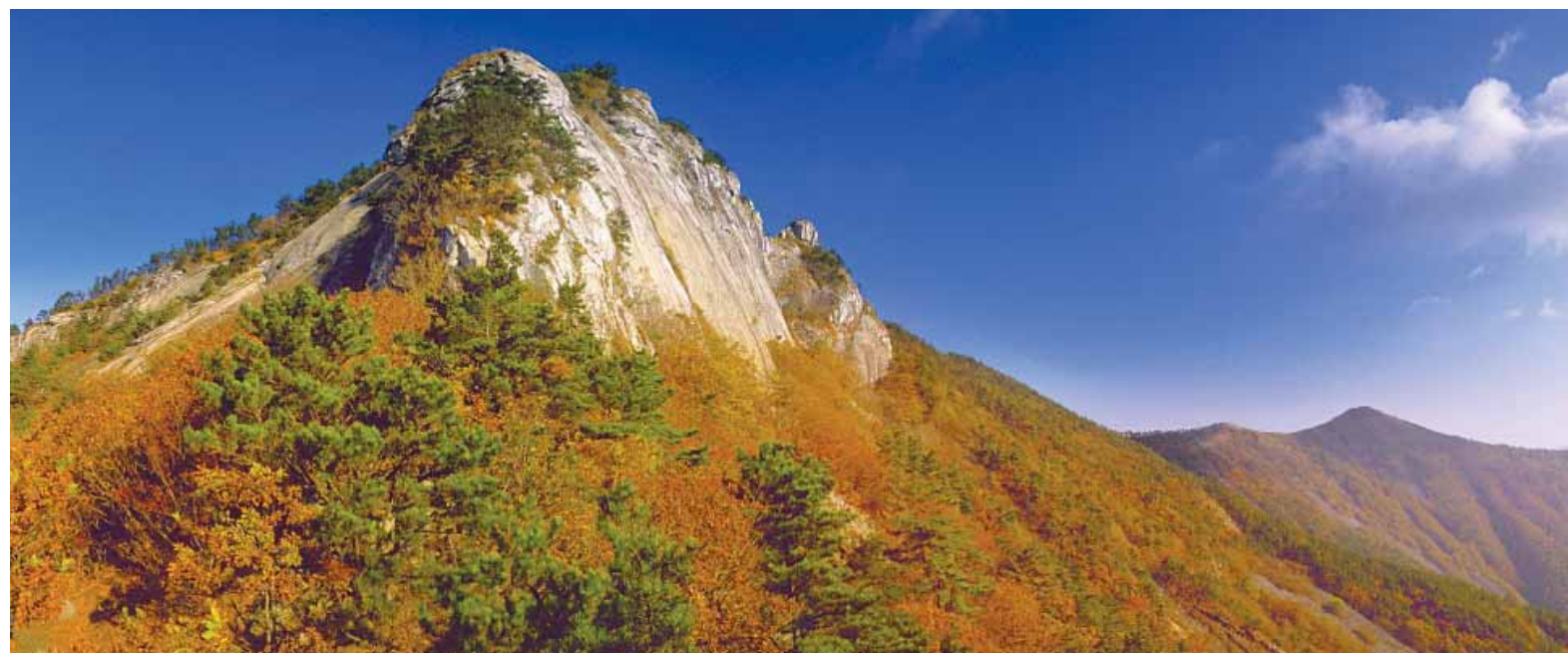
사천시에 소재한 와룡산의 가을 전경(사천 사계절 사진공모전 입선작).

오늘을 살고 있는 우리들아! 나옹선사(懶翁禪師)의 청산혜요아(靑山兮要我)의 글귀가 생각난다. /이윤석·벨리동