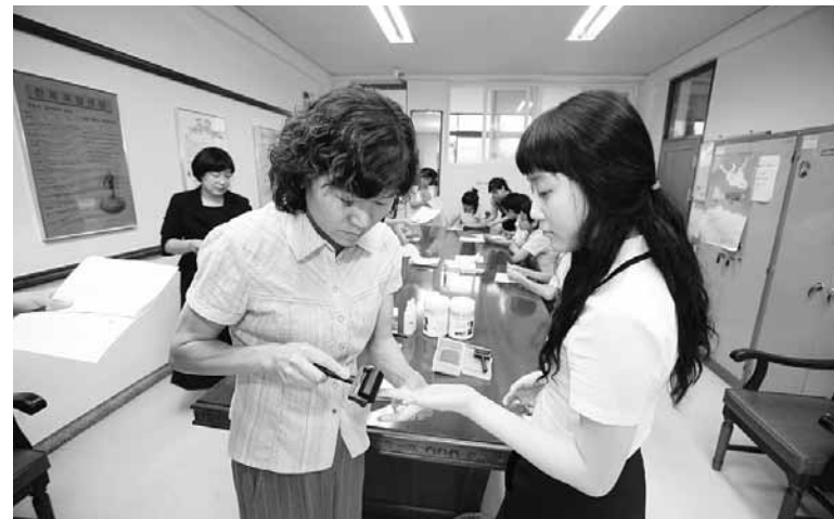
관내 한 고등학교를 방문해 신규주민등록증 발급대상 학생에게 주민등록증 발급을 위한 지문을 채취하고 있다.

현재 주민등록증 신규발급대상자는 만 17세가 되는 달의 다음달 1일부터 6개월 이내 주소지 관할 읍면동에 의무적으로 발급신청토록 되어 있으며, 이를 어길 경우 최소 5천원부터 최대 5만원의 주민등록증 지연과태료를 납부해야 된다.