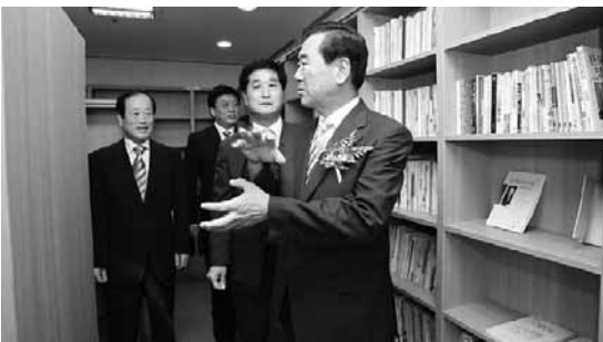
삼한노인대학에 작은도서관 개관식에 참석한 김수영 시장이 도서관 내부를 둘러보고 있다.

이날 김수영시장은 인사말을 통해 "독서는 젊은이에서만 하는 것이 아니라 몸은 늙어도 독서 회피의식에서 벗어나 독서를 통해 젊어 질 수 있다는 인식을 갖게 되는 중요한 계기가 될 것"으로 기대한다고 말했다.