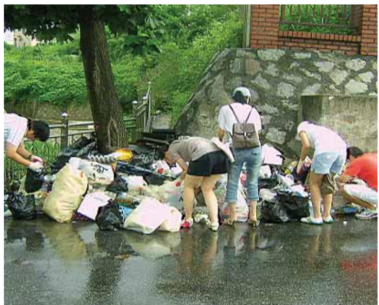
사천시는 규격봉투를 사용하지 않는 비양심적인 쓰레기 불법투기자를 끝까지 집중 단속할 계획이다.