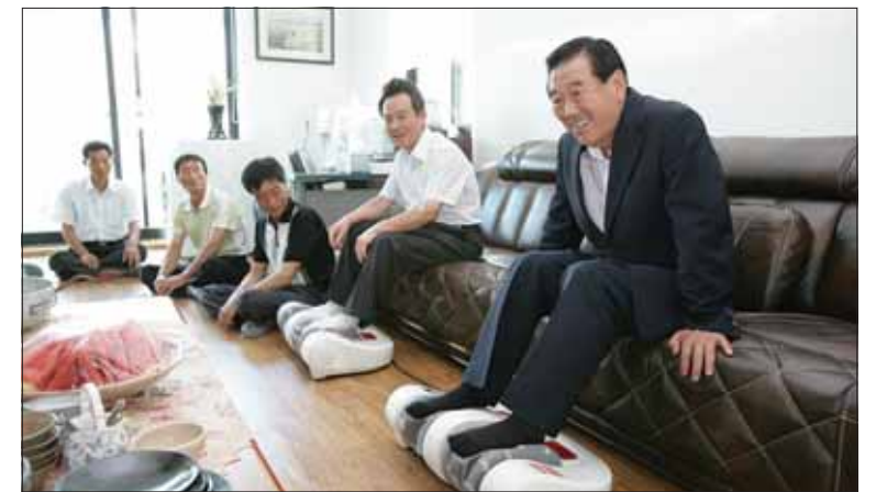
김수영 시장이 용현면 통양 보건진료소를 방문해 내부시설을 체험하고 주민들과 답사를 나누고 있다.

한편 시는 시민 모두가 쾌적한 환경에서 의료시혜를 받을 수 있도록 노후된 공공보건의료기관을 연차적으로 개선할 계획이며, 보건행