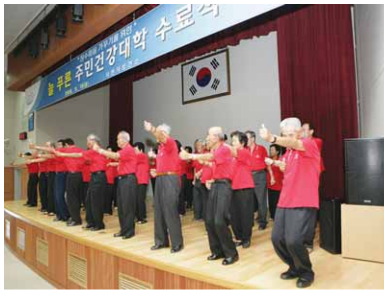
지난 9월 19일 시청대강당에서 개최된 늘 푸른 주민건강대학 수료식에서 수료자들이 기념공연을 하고 있다.

사례중심의 체험교육이 인기를 얻었다. 주민건강대학 수료자의 고혈압과 당뇨 등 성인병에 대한 지식과 인식도를 비교 설문한 결과 교육 이전에는 평균 48점에서 교육 수료 시는 평균 66점으로 건강에 대한 인식과 의식수준이 높아졌다. 또한 건강습관과 운동실천은 교육 전에는 50%에서 수료 시에는 76%로, 올바른 먹거리 선택은 교육 전에는 41%에서 67%로 실천하는 변화의 폭이 크게 달라졌다. 한편 시 보건소는 주민 다수가 참여하고 지역주민이 흥미를 가질 수 있는 주민건강대학을 다양한 계층의 차별화된 건강 프로그램을 운영할 계획이다.