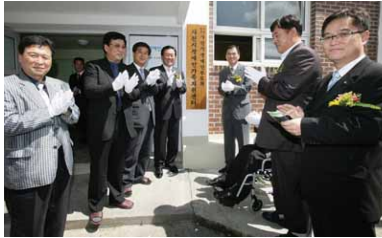
(구)동성초등학교를 일부 개·보수해 장애인과 장애인 가족들을 지원하기 위해 사천시 장애인가족지원센터를 개소했다.

현재 사천시에 등록된 장애인은 6280명으로 그동안 장애인과 가족들이 겪고 있는 여러 가지 어려움을 서로 토의하고 극복방안을 상담할 장소가 없어 어려움을 겪고 왔다. 하지만 이번 가족지원센터 개소로 장애인 복지회관과 연계한 장애인의 폭넓은 장소로 활용가치가 높아질 것으로 기대되고 있다. 한편, 시는 소외되기 쉬운 장애인과 장애인가족들에 대한 상담 지원으로 그동안 겪고 있는 어려움을 서로 해소하는 창구역할이 될 뿐 아니라, 대인관계와 자립적 생활능력 향상에 좋은 계기가 될 것으로 기대하고 있다.