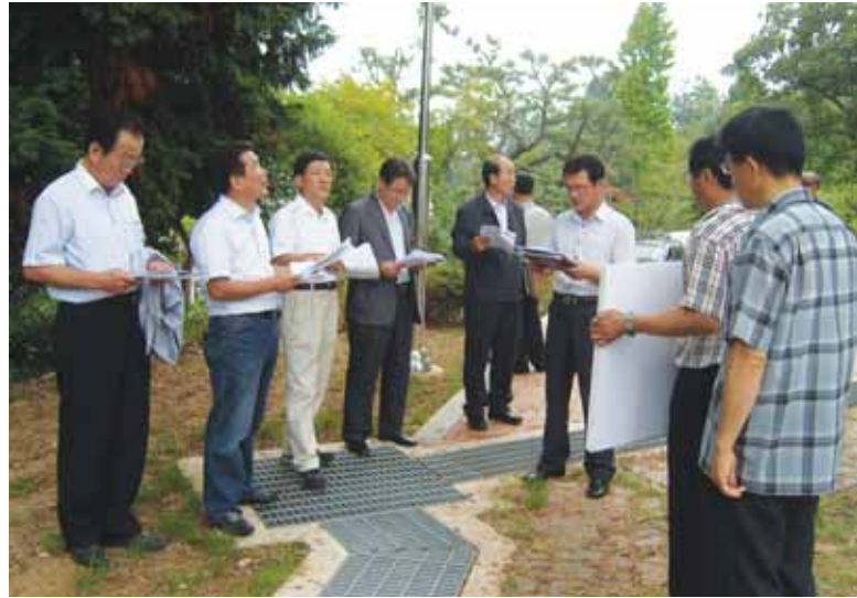
지난 제128회 임시회 기간중 총무위원회는 (좌) 박재삼 문학을, 산업건설위원회는 (우) 삼천포중앙시장 비가림시설 사업 현장을 방문했다.

위원회와 산업건설위원회의 현장 방문이 있었으며, 도출된 문제점에 대하여는 의회 차원에서 대책을 강구하여 시정에 적극 반영할 계획이다.