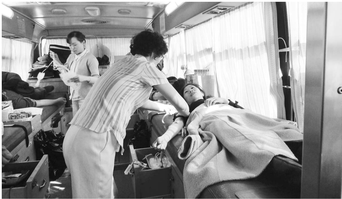
에게 헌혈증서를 기증받아 백혈병과 혈액암, 출혈 등으로 다량의 혈액이 필요한 어려운 환자들에게 지원하여 따뜻한 온기를 전하는 사랑의 나눔 행사도 함께 펼쳤다.

사천시는 오는 3월 31일까지 전 읍·면·동에서 「주민등록 일제정리」를 실시한다.