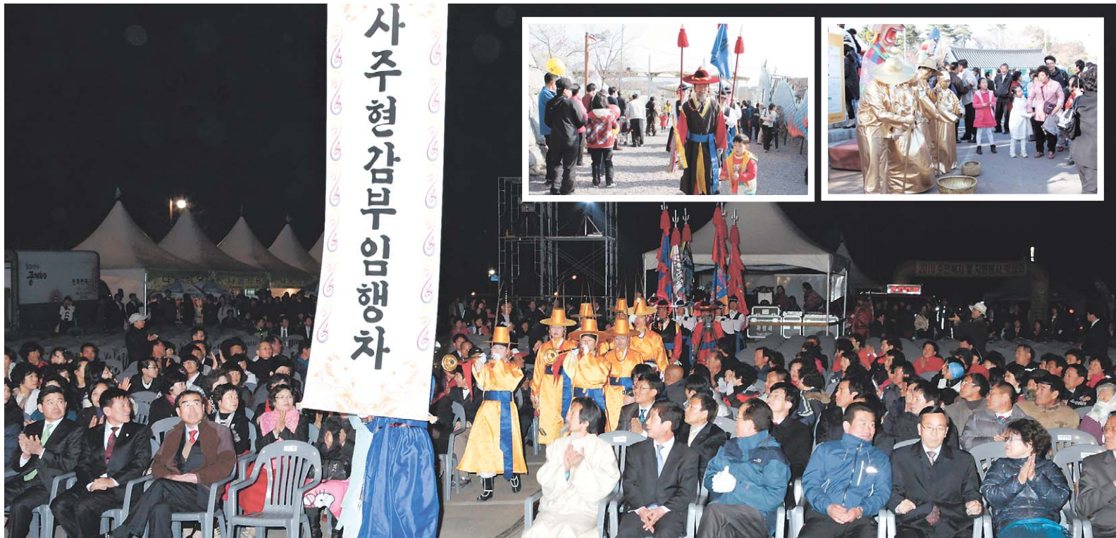
지난해 와룡문화제 사주현감부임행차 광경