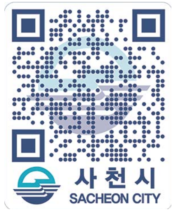
QR코드 홍보용 스티커.

앞으로 각종 홍보물 제작시에 QR코드를 삽입하여 배부함으로써 누구나 쉽게 QR코드를 접속할 수 있도록 할 계획이다.