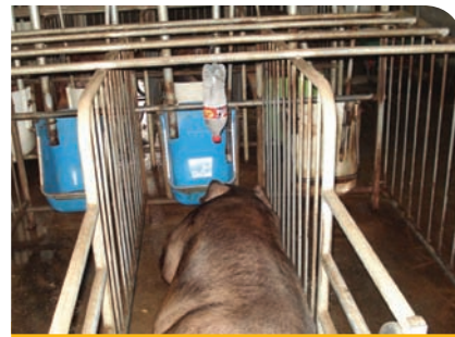
열린 페트병을 활용한 점적방법